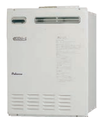
本体・操作パネル