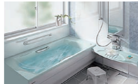
本体 (排水ボタン) 浴室換気 (暖房) 乾燥機・水栓