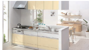
コンロ (ガス・IH)・レンジフード ビルトイン浄水器・水栓 ビルトイン食器洗い乾燥機