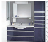
本体 (照明・くもり止め ヒーター・排水ボタン) 換気扇・水栓