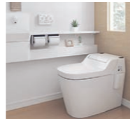
本体・機能付便座 手洗器・換気扇